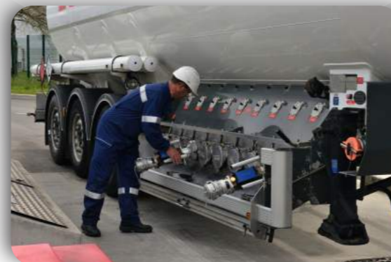
FLEXICOMPT AUTONOME +

Compteur autonome pour le contrôle des réceptions